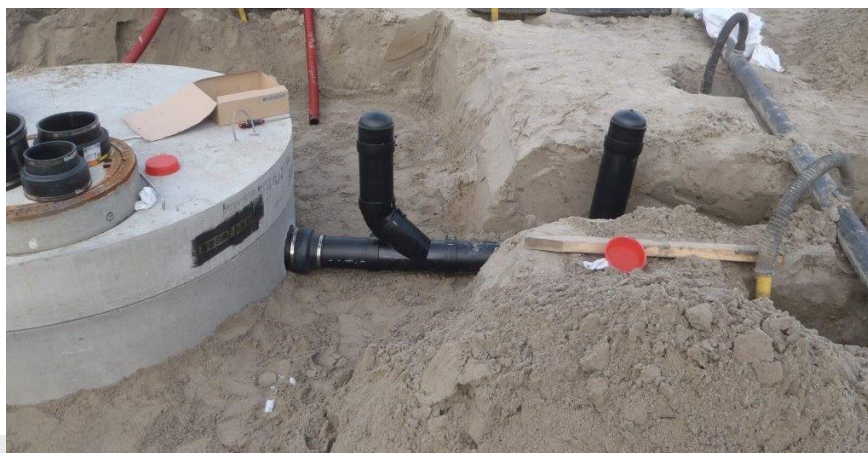
Foto: Voorbeeld van voorzieningen voor controle van de bedrijfsriolering op waterdichtheid. Aansluiting van de bedrijfsriolering (hdpe) op de prefab betonnen slibvangput.

Om het beproeven van de dichtheid te kunnen uitvoeren, monteert de aannemer in de toevoerleiding naar de slibvangput, kort voor de aansluiting daarop, een T-stuk van 90° en/of een T-stuk van 45°, of een andere installatie waarmee leidinggedeelten eenvoudig kunnen worden afgesloten en beproefd.