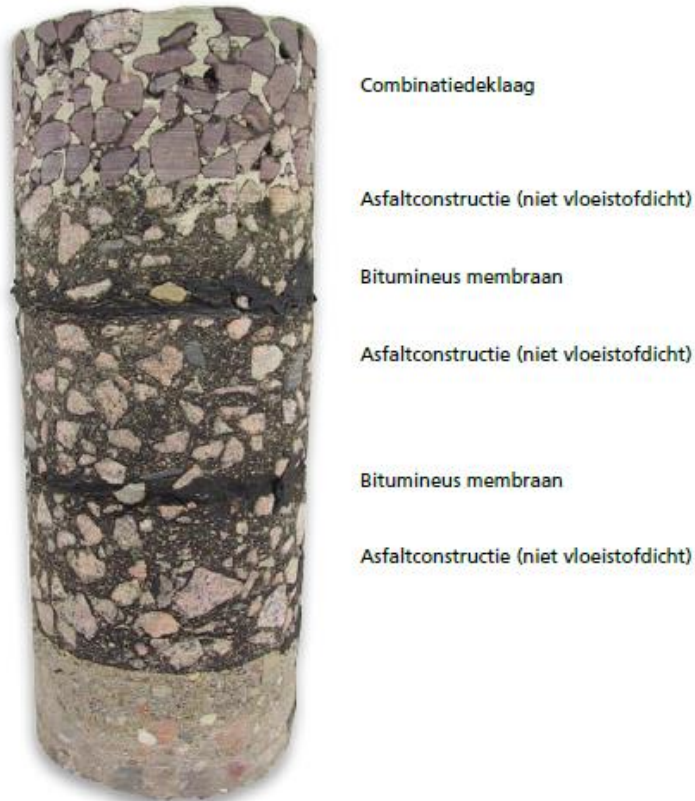
Foto: Voorbeeld van de opbouw van een combinatiedeklaag.