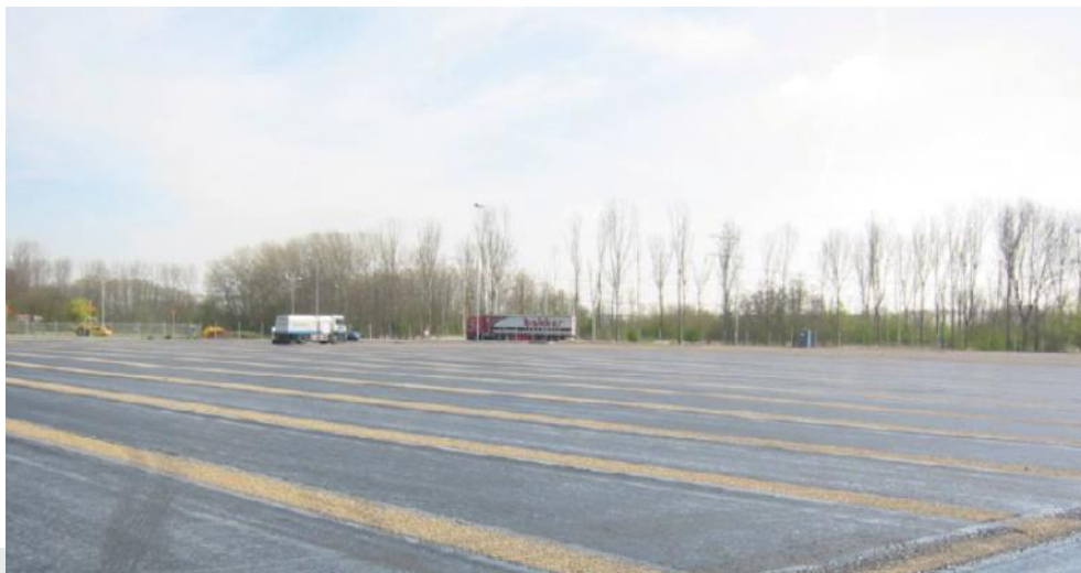
Foto: Aanleg vloeistofdichte asfaltconstructie (bron: VBW Handleiding vloeistofdichte bitumineuze constructies).

Voor betonreparaties geldt NEN-EN 1504 deel 1 t/m 10 [14]. Hoofdstuk 7 van CUR/PBV-Aanbeveling 65 is niet van toepassing.