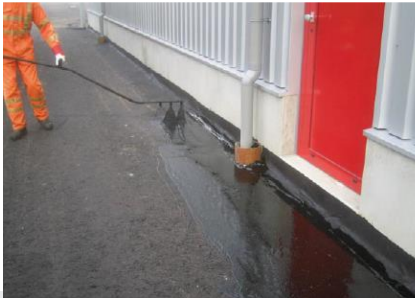
Foto: Aanbrengen bitumineus membraan.

De aannemer voorkomt dat het membraan zijn afdichtende eigenschappen verliest, door bijvoorbeeld beschadigingen door mechanische belasting of door een te hoge temperatuur van de laag die op het membraan wordt aangebracht.