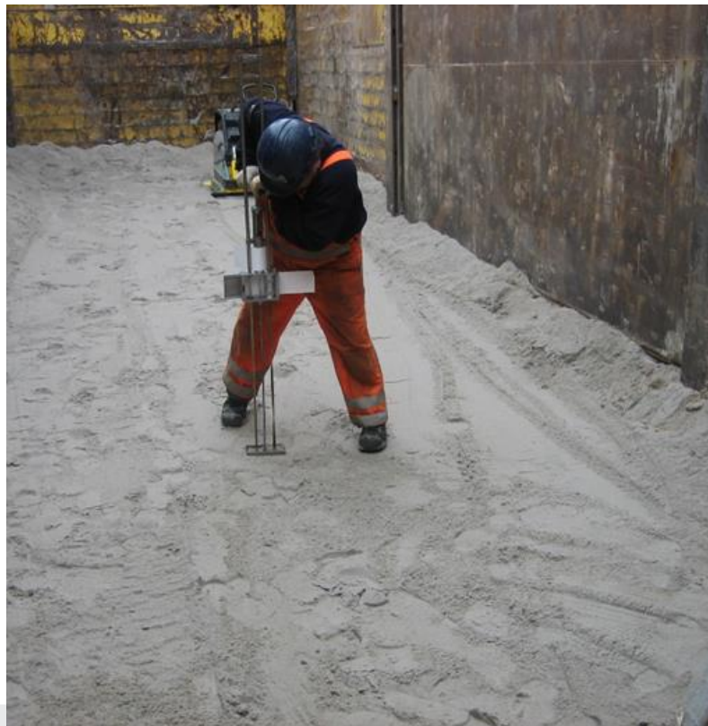
Foto: Voorbeeld van een controlemeting van de indringweerstand.